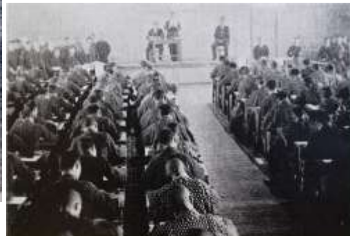
(豊商の群像 II より抜粋)