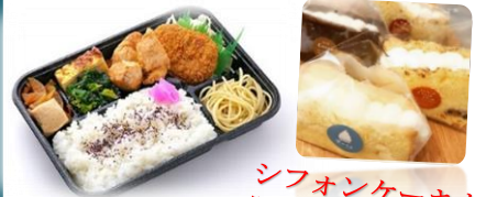
シフォンケーキも販売します